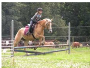
Een buitenrit of in de crosswei is in de zomer vaak geen enkel probleem.